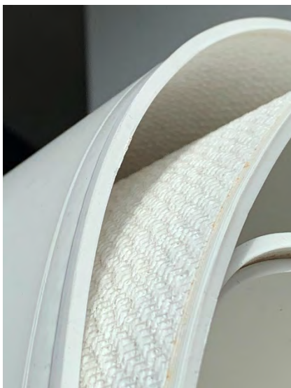
Abbildung 2: PVC Versiegelung für Transportbandkante